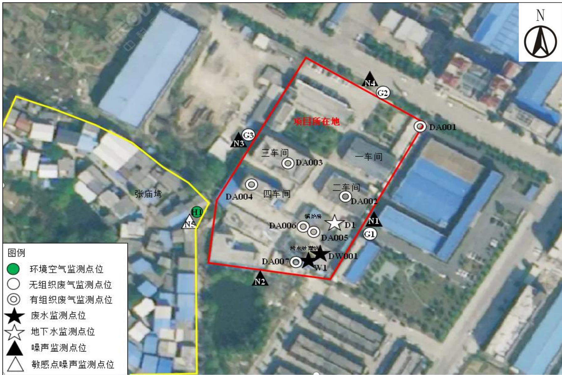
附图 7 项目监测点位图