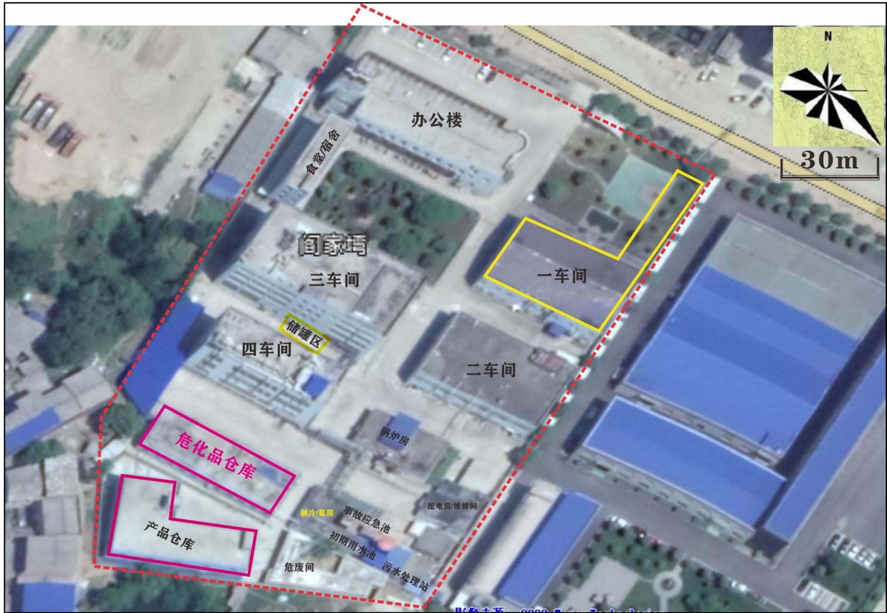
附图3 项目平面布置图