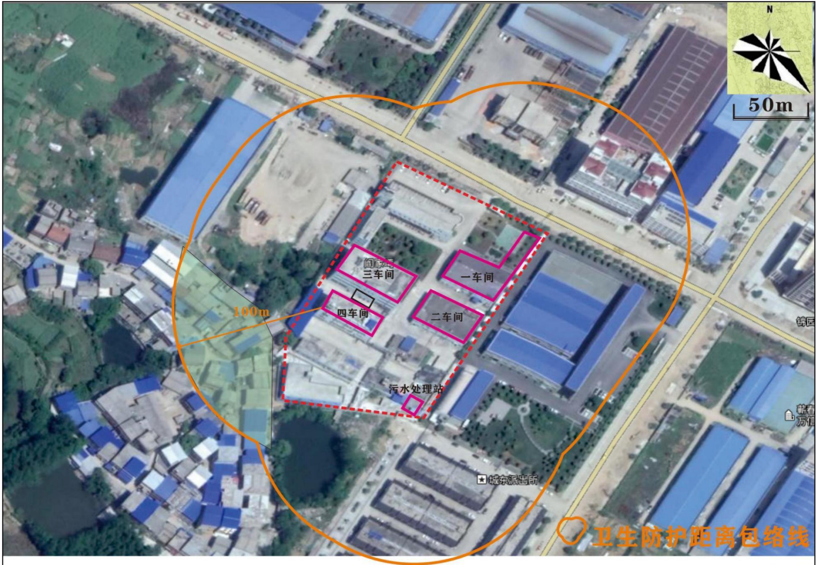
附图4 项目卫生防护距离包络线图